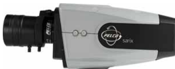
Série Sarix IX Câmera fixa de alto desempenho