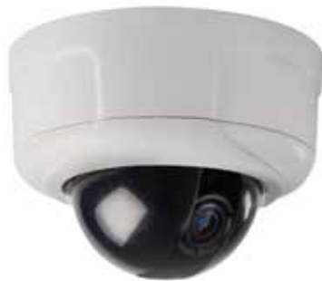
Série Sarix IM Câmera de minidomo para uso interno